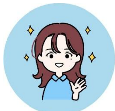
ようごきやうゆ 養護教諭

必ずしも、病気や異常を確定するものではありませんが お子さんの健康保持のためにも、「治療勧告書」が届いたら、必ず専門医の検査を受けてください。